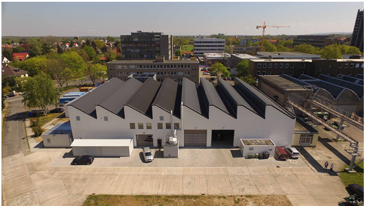
Das Gebäude der Battery LabFactory