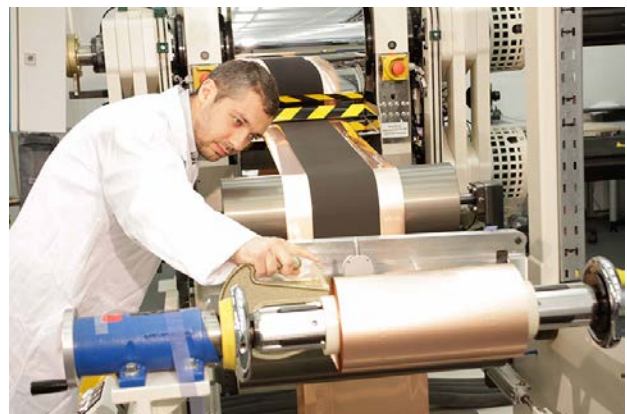
Verschiedene Schritte bei der Fertigung einer Batterie

Die Mischung macht's. Zu Beginn des Herstellungsprozesses einer Batterie werden die Komponenten zu einer Paste vermischt (Dispergierung). In einem zweiten Arbeitsprozess wird die gewonnene Mischung beschichtet und verdichtet. Vier weitere Schritte sind bis zur Fertigstellung notwendig. Haselrieder vergleicht den Prozess mit dem Backen. Omas Kuchen hat immer am besten geschmeckt. Das Rezept war bekannt, aber nur Oma konnte den Kuchen so backen, wie er am besten schmeckte. Woran lag das? Hat sie doch ein bisschen mehr Zucker genommen? Hat sie den Teig länger geknetet? Hat sie ihn mit den