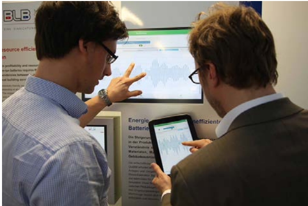
Zwei Mitarbeiter bei der Arbeit

Mehrere Mitarbeiterinnen und Mitarbeiter des Teams hatten bereits von dem Europäischen Fonds für regionale Entwicklung (EFRE) gehört und sahen darin eine der wenigen Möglichkeiten, das Projekt in Schwung zu bringen. Andere Fördermittel für solche Projekte sind rar gesät. Also hat man sich zusammengesetzt und einen Antrag beim Land Niedersachsen auf EFRE-Mittel gestellt. Eine treffendere Richtlinie zur Förderung hätte es nicht geben können: „Förderung von Innovationen und wissensbasierter Gesellschaft durch Hochschulen, Forschungseinrichtungen, Einrichtungen der Erwachsenenbildung und Berufsakademien.“