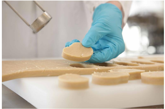
Mitarbeiter stellen vegetarischen Fleischersatz her

Die 2,5 Mio. Euro aus dem EFRE kommen kleinen und mittelständischen Unternehmen aus der Projektregion mit Bezug zur Agrar- und Lebensmittelwirtschaft zugute. Damit werden Personal- und Dienstleistungskosten in Form von finanzieller und fachlicher Unterstützung zur Umsetzung innovativer Ideen gefördert.