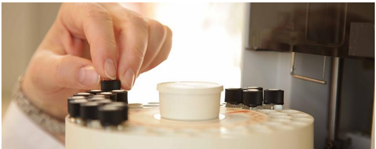
Eine Mitarbeiterin macht den Qualitätstest

Als Teil der europaweiten Kohäsionspolitik, in der wirtschaftlich starke Regionen den Ärmern unter die Arme greifen, gleicht der Europäische Fonds für regionale Entwicklung strukturelle Ungleichheiten zwischen den Regionen Europas aus. Der Europäische Sozialfonds fördert die Beschäftigung in Europa. Mithilfe des EFRE und ESF soll überall in Europa das intelligente, nachhaltige und integrative Wachstum gefördert werden. Die Umsetzung erfolgt in sogenannten Förderperioden, die eine strategische Planung der Mitteleinsätze über einen längeren Zeitraum voraussetzen. Für die aktuelle Förderperiode 2014-2020 stehen dem Land Niedersachsen knapp 1 Mrd. Euro EU-Fördermittel aus dem EFRE und dem ESF zur Verfügung.