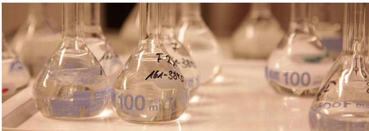
Auf dem Weg zu neuen Produktkreationen

Damit soll nach und nach mit Hilfe der EFRE-Förderung stufenweise eine Modellregion für eine zukunftsfähige Ernährungswirtschaft aufgebaut werden. Auf die Frage nach der Idee zum Projekt antwortet Christian Kircher, ebenfalls vom DIL: „FOOD2020 baut auf dem erfolgreich abgeschlossenen Interreg IV-A Projekt FOOD FUTURE auf, durch das in einem Zeitraum von 5 Jahren über 1.000 Unternehmen erreicht und mehr als 140 kleine und mittelständische Unternehmen in ihrem Innovationsprozess unterstützt wurden, Kontakte zu Wissensinrichtungen aufgebaut haben und neue Produkte und Prozesse entwickeln konnten. In FOOD2020 werden die erfolgreichen Aktivitäten fortgeführt und inhaltlich weiterentwickelt.“